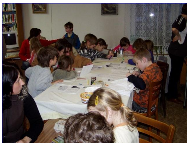
Foto č. 17 - Těšíme se na Velikonoce, 2008

V roce 2009 pokračovaly počítačové kurzy, pletly se košíčky z papíru a také proběhla beseda nad kronikou naší obce. Knihovnu navštívily děti z místní mateřské školy, ale také přespolní děti ze družiny v Žalkovicích. 18