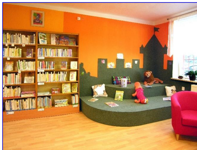
Foto č. 10 - Pódium pro děti po 2. etapě rekonstrukce v roce 2009