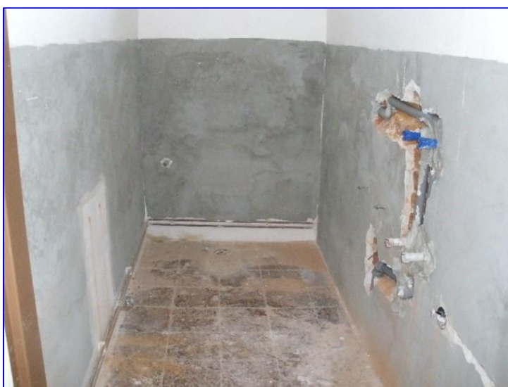
Foto č. 7 - Oprava čistící zóny, kde je umístěn plynový kotel, v roce 2009

zvířátka. Nábytek byl doplněn o 2 křesílka, stolek, 5 židlí a 10 skládacích židliček pro nárazové akce. Díky Diplomu za vzorně vedenou knihovnu získala obec dotaci 20 000 Kč, z vlastních prostředků věnovala opravě 36 021 Kč. Na opravě se podílel Rostislav Otáhalík ze Žalkovic (podium pro děti a odkládací stěna), Michal Bitala a David Krajčoviech z místní firmy Podlahářství BIKR (koberec na podiu a hrad), Lenka Vymětalová (výběr nábytku a doplňků), Ladislav Kachman (vodo-topo), Antonín Kobza z Roštění (obklady WC a předsíně), Karel Pokorný (montáž dveří a ohřivače vody), Petr Pokorný (čistící zóna), Růžena Hudečková (aranžování interiéru). 8