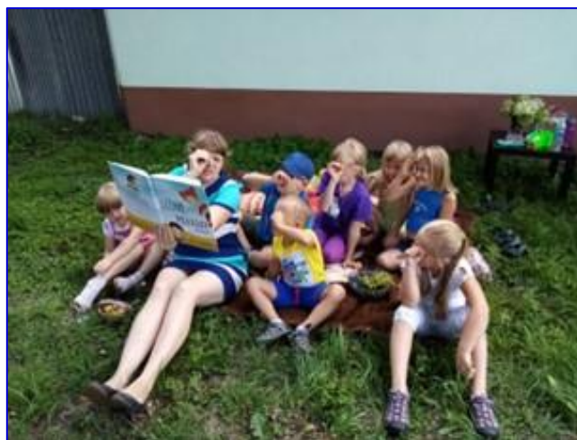
Foto č. 29 – Prázdninové čtení č. 3 v roce 2021