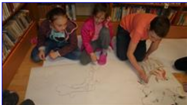
Foto č. 61, 62 – Noc s Andersenem, rok 2019