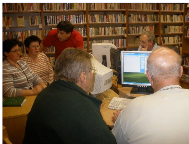
Foto č. 19 - PC kurz na přelomu roku 2010/2011