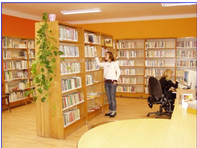
Foto č. 5 - Knihovna v novém kabátě po 1. etapě rekonstrukce v roce 2008