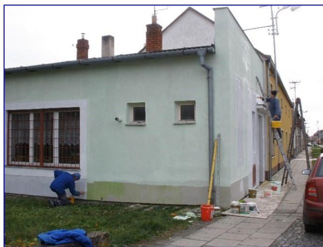
Foto č. 13 - Malířské práce na fasádě v roce 2013