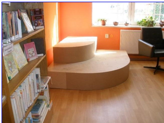
Foto č. 9 - Výroba pódia pro děti v roce 2009