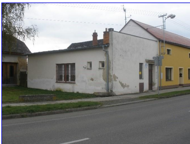
Foto č. 12 - Fasáda před opravou v roce 2012