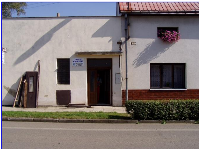
Foto č. 3 - Výměna vchodových dveří v roce 2008

k výměně osvětlení, plynového topení i podlahové krytiny. Byly vyměněny vchodové dveře. Místnost byla vymalována zářivými barvami a byla částečně vybavena novým nábytkem. Regály s knihami byly nově uspořádány. Celkové náklady na opravu činily 183 000,-Kč. Byl rozšířen počet internetových stanic. Knihovna tak svým návštěvníkům mohla nabídnout celkem 3 počítače s přístupem k internetu. 17