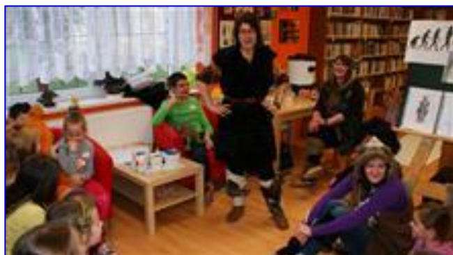
Foto č. 57, 58 – Noc s Andersenem, rok 2019