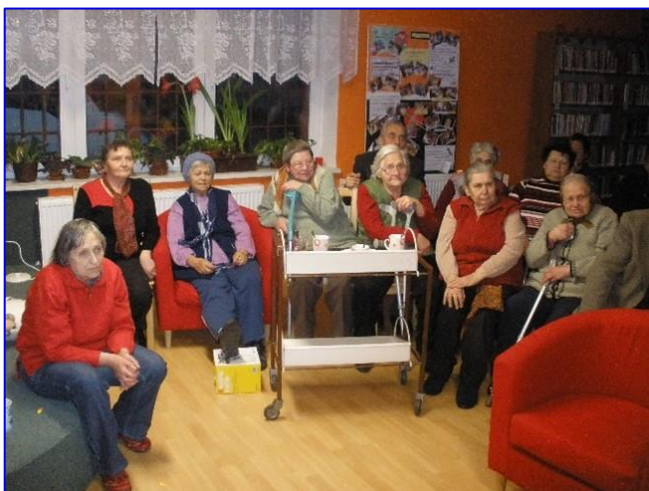
Foto č. 20 - Přednáška na téma „Jste doma v bezpečí?“ v roce 2011