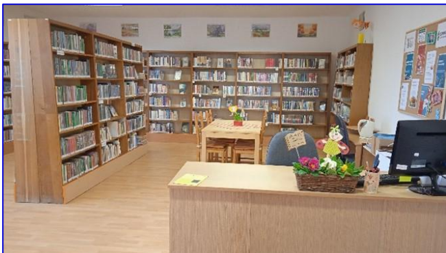
Foto č. 14 - Interiér knihovny v roce 2021

V roce 2021 pak byla provedena nová výmalba vnitřních prostor, přidány 2 vyřazené knihovní regály z Městské knihovny v Chropyni, některé starší nepoužívané skříňky vyřazeny a výpůjční prostor byl upraven tak, aby lépe sloužil automatizovanému výpůjčnímu systému.