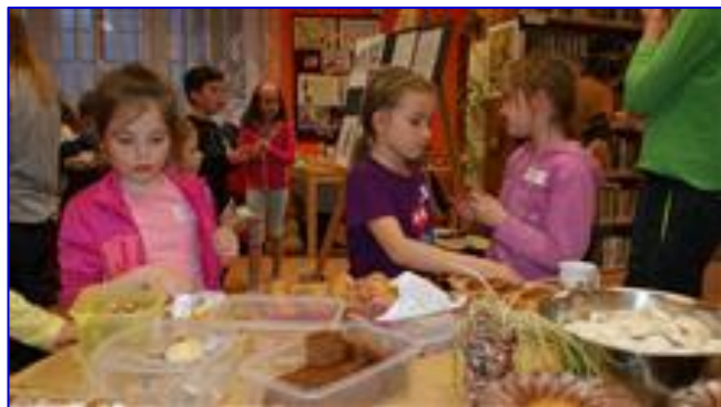
Foto č. 59, 60 – Noc s Andersenem, rok 2019