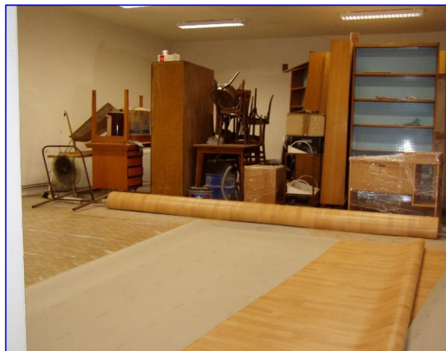
Foto č. 2 - Pokládka nového linolea v roce 2008

V roce 2008 proběhla první etapa rekonstrukce. 31. července 2008 byla knihovna naposledy otevřena pro čtenáře. Znovu otevřena pak byla 23. října 2008. Během těchto tří měsíců prošla knihovna velkou změnou. Došlo