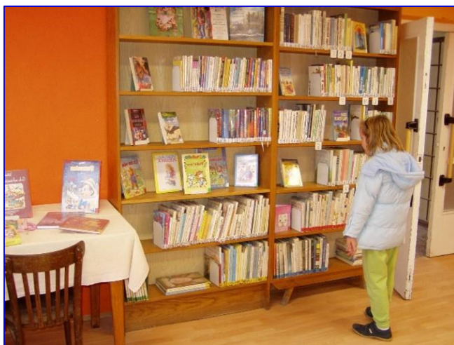
Foto č. 6 - Knihovna v novém kabátě po 1. etapě rekonstrukce v roce 2008

V roce 2009 pak proběhla druhá etapa rekonstrukce interiéru knihovny. Kronikářka obce zapsala: „Bylo opraveno sociální zařízení (nové obklady, dlažba, záchod, ohřívač vody, dveře). Také nová dlažba ve skladě a předsíni, tam také čistící zóna. V knihovně bylo vyrobeno pro děti pódium potažené kobercem, za ním na zdi vytvořen krásný hrad, na podiu polštářky a plyšová