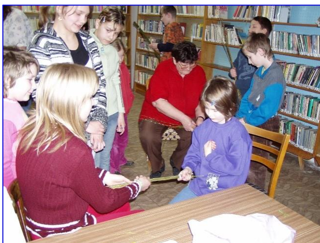
Foto č. 16 - Těšíme se na Velikonoce, 2008