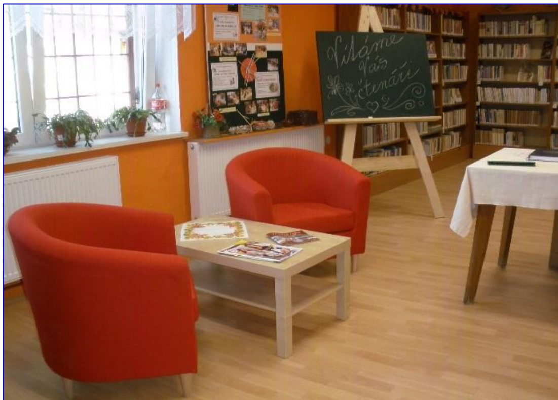
Foto č. 11 - Nové vybavení interiéru v roce 2009

V roce 2009 provedly metodičky z Knihovny Kroměřížska aktualizaci knihovního fondu, který byl zapsán do knihovního systému TRITIUS. Dále byl vytvořen elektronický katalog knih, který je dostupný na internetu. Od roku 2021 pak knihovna přešla na automatizovaný systém výpůjček. Došlo ke zrušení papírové evidence výpůjček a celý výpůjční systém probíhá on-line.