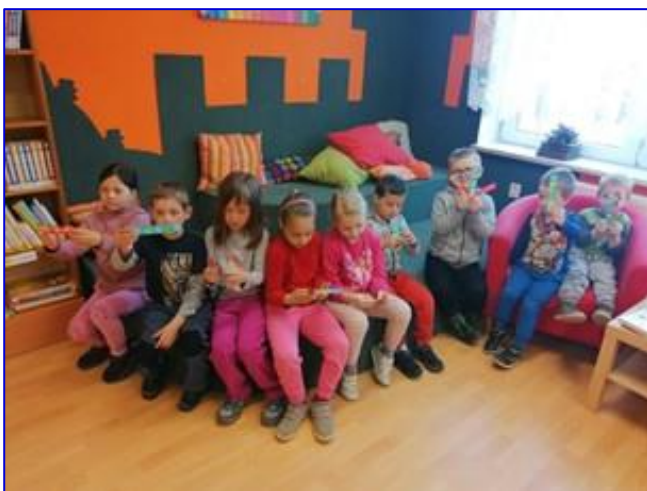
Foto č. 28 – Knihovnická lekce, děti z MŠ v Kyselovicích v roce 2021