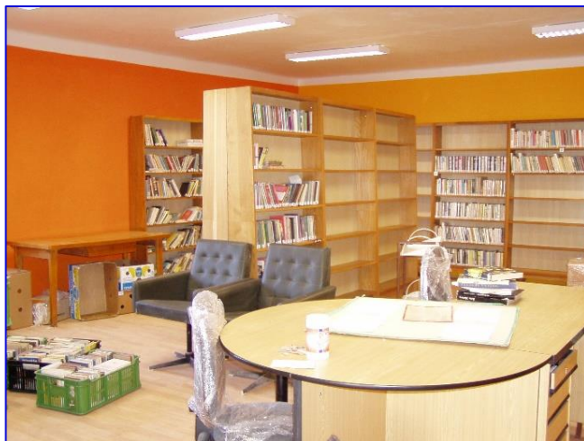
Foto č. 4 - Stěhování knihovního fondu zpět do knihovny po 1. etapě rekonstrukce v roce 2008