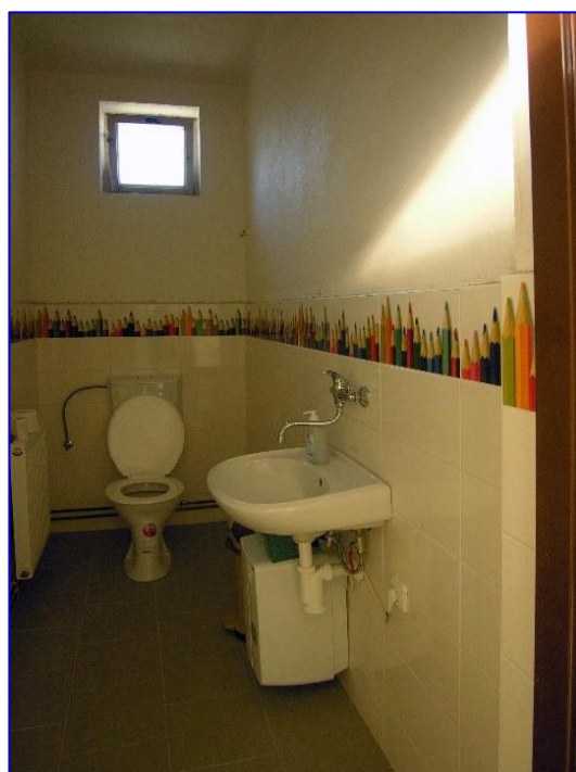
Foto č. 8 - Sociální zařízení po 2. etapě rekonstrukce interiéru v roce 2009